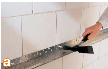
a Prieš klijuodami izoliacines plokštes, sumontuokite pradinį profiliuotį.