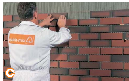
c Po to plyteles stipriai prispauskite prie skiedinio paviršiaus. Tai darydami, stebėkite, kad neilktų tuštumų ir laisvos erdvės. Suklojus dangą, skiedinio sluoksnio storis turi būti ne mažesnis kaip 3 mm. Po pradinio siūlių sustingimo, jas reikia iki tam tikro gylio (ne mažiau kaip per plytelių storį) iškrapštyti ir išvalyti.