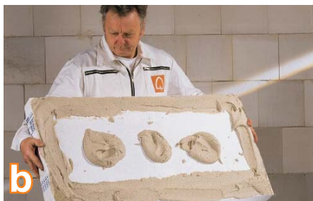
b Taikydami pakraštinių-taškinių metodą, izoliacines plokštes priklijuokite quick-mix skiediniu RKS .