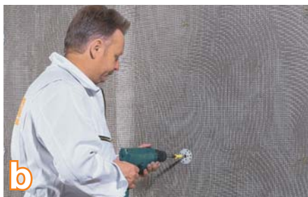
b Tvirtinimas mechaniniais jungiamaisiais elementais su metaline šerdimi yra atliekamas tuojau pat po nuglaistymo pirmuoju glaisto RAS sluoksniu. Jungiamieji elementai montuojami šviežiame skiedinyje.