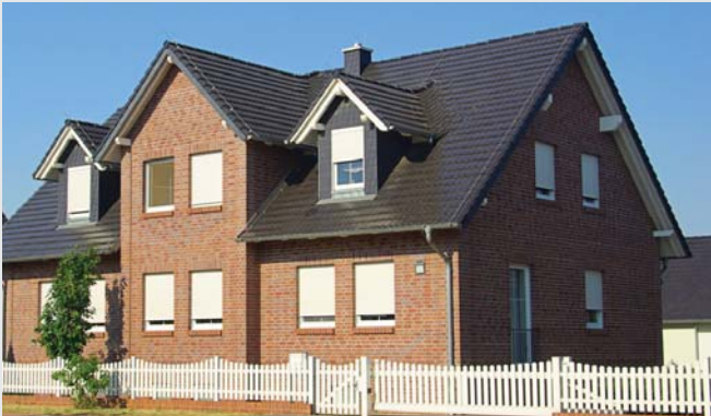
Geriausi skiediniai klinkeriui mūryti