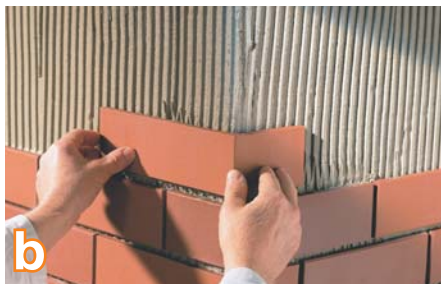
b Klinkerio plyteles klijuoti pradėkite nuo pastato kampų. Verta panaudoti sistemai priklausančias kampines detales – tai padės gauti gražiai atrodantį ir ilgaamžį fasadą.