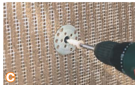
c Prispaudus jungiamojo elemento lėkštelę, ji turi būti nugrimzdusi į šviežią skiedinį. Tuojau pat po jungiamųjų elementų sumontavimo reikia užtepti kitą skiedinio RAS sluoksnį (šviežią ant šviežio) taip, kad būtų pasiektas bendras 7–10 mm storio armuotasis sluoksnis.