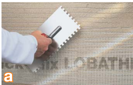
a Ne plonesniame kaip 7 mm storio quick-mix glaisto RAS sluoksnyje visiškai nugramzdinkite armavimo tinklą QMS 145 arba QMS 165 .