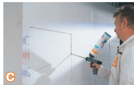
c Tarp plokščių likusius plyšius užpildykite žemo slėgio montazinėmis putomis.