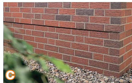
c Sistema LOBATHERM P su klinkerio plytelėmis, kaip ilgaamžė, ekonomiškai ir gražiai atrodanti alternatyva fasadinei klinkerio plytai.