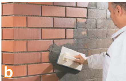
b Glaistyti siūlių glaistu RSS galite, praėjus 7 paroms po plytelių klijavimo. Dumblo konsistencijos quick-mix siūlių glaistą RSS įstrižai siūlėms užtepkite tvirta gumine juosta arba guminiu brauktuvu. Glaistą kaip reikiant įspauskite į siūles tarp plytelių. Glaisto perteklių pašalinkite mentele su gumine juoste. Glaistui truputį išdžiūvus, plytelių paviršius kelis kartus nuplaukite šlapią kempine (quick-mix RSS naudokite tik glazūruotoms neįgeriančioms plytelėms su glotniu paviršiumi).