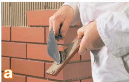
a Kai armuotasis sluoksnis visiškai sustingęs (technologinė pertrauka ne trumpesnė kaip 7 paros), galima pritvirtinti keraminę dangą. Plyteles reikia klijuoti taip vadinamu kombinuotoju metodu (floating-buttering). Ant sustingusio armuotojo sluoksnio dantiyta mentele (dantukai 8 x 8 x 8 mm arba 10 x 10 x 10 mm) užtepkite maždaug 3–4 mm storio klijų sluoksnį. Ant blogosios plytelės pusės užtepkite ją visą dengiantį 1 mm storio klijų sluoksnį.