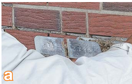
a Siūles galite glaistyti, praėjus ne mažiau kaip 14 parų po plytelių klijavimo. „Šlapios žemės“ konsistencijos quick-mix siūlių glaistą RFS siūlių glaistymo mentele kaip reikiant įspauskite į siūles. Siūles glaistykite dviem etapais, taikydami metodą „šviežias ant šviežio“.